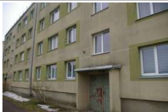
Būve ar kadastra apzīmējumu 1700 021 0115 001