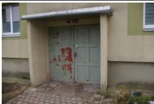
Būve ar kadastra apzīmējumu 1700 021 0115 001