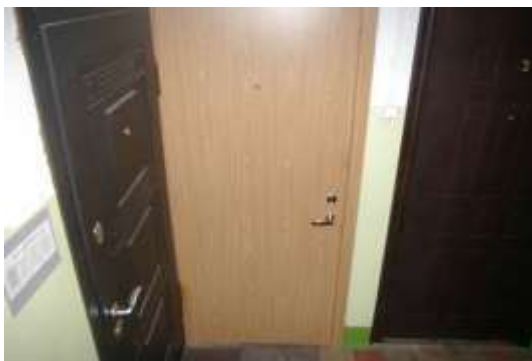
Dzīvojamā ēka ar kadastra apzīmējumu 1700 021 0115 001, dzīvoklis Nr.2