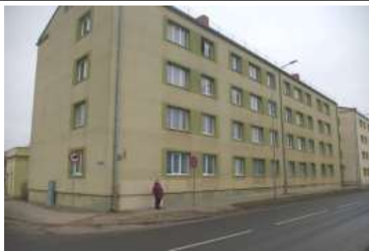
Būve ar kadastra apzīmējumu 1700 021 0115 001