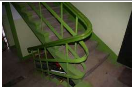
Dzīvojamā ēka ar kadastra apzīmējumu 1700 021 0115 001, koplietošanas telpa